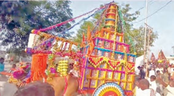
మల్లికార్జున స్వామి జాతరలో ఎండ్ల బండ్లు తిరుగుతున్న దృశ్యం