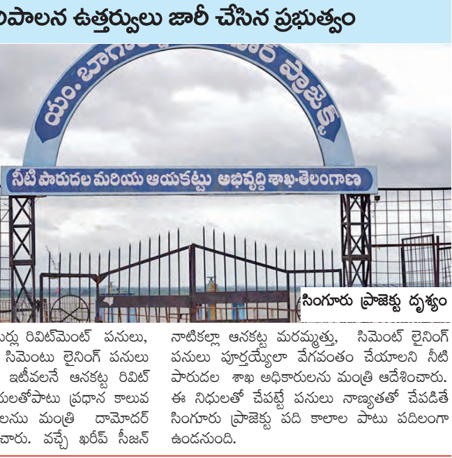
సింగూరు ప్రాజెక్టు దృశ్యం

ఇరువైపుల 6 కిలో మీటర్లు రివిటివేషన్ పనులు, ప్రధాన ఎడమ కాలువ సిమెంటు లైనింగ్ పనులు ప్రారంభం అయ్యాయి. ఇటీవలే ఆనకట్ట రివీల్ మెంట్ పునరుద్ధరణ పనులతోపాటు ప్రధాన కాలువ రాజనర్సింహ ప్రత్యేక పోషణ తీసుకుని రూ. 8.14 కోట్లు మంజూరు చేయించారు. ఇప్పటికే ప్రాజెక్టు నాణ్యతా ఆసక్తి పరమృత్తు, సిమెంట్ లైనింగ్ పనులు పూర్తయ్యేలా వేగవంతం చేయాలని నీటి ప్రారంభం అయ్యాయి. ఈ నిధులతో వేపట్ల పనులు నాణ్యతతో చేపడిసి సింగూరు ప్రాజెక్టు పది కాలాల పాటు పదిలంగా ఉండవచ్చు.