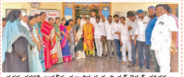
పదవ తరగతి టాపర్లను సన్మానిస్తున్న మున్సిపల్ చైర్మన్ తదితరులు